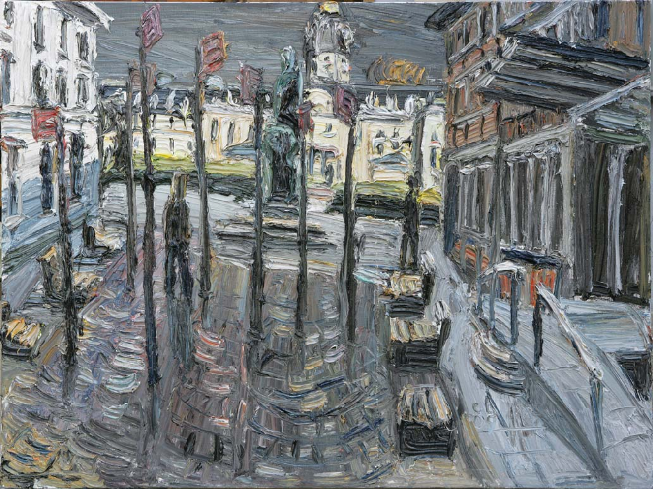
Christopher Lehmpfuhl, Platz der Grundrechte, 2009, Öl auf Leinwand, 180 x 240 cm

„Abermals ist eine ganz eigene Atmosphäre der herangezoomten Szenen und weiten Perspektiven entstanden: Es dominieren das immer wieder andere Grau des Winterhimmels, lange schwarze Schatten. Abendstimmungen, Passanten als schwarz angedeutete Bewegungslinien. Karge Natur, Baumstämme, Dächer als krude Vertikalen und Horizontalen in Schwarz. Auch der Eindruck von Nässe und klirrender Kälte vor kleinen Kirchen, dem Weihnachtsmarkt, dem Platz der Grundrechte, dem ZKM.“