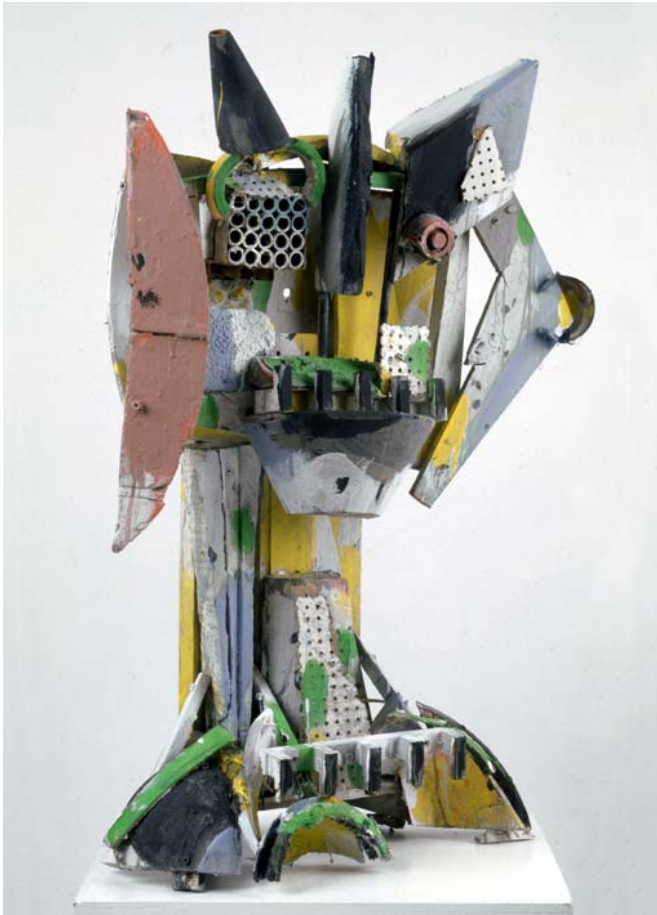
Menno Fahl, Königin, 2009 verschiedene Materialien bemalt, 225 x 50 x 35 cm