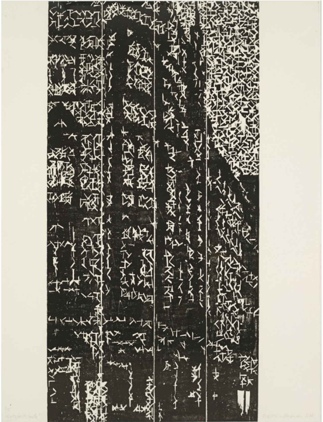
Winterfeldtstraße, 2012, Holzschnitt, 160 x 120 cm