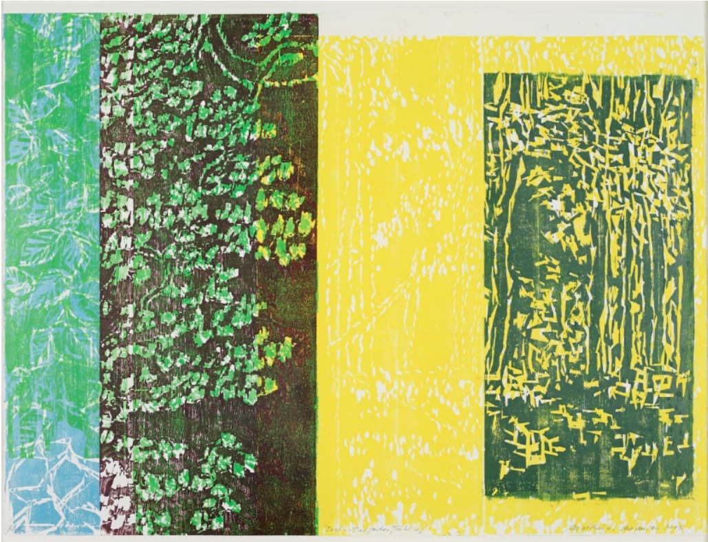
Berlin-Tiergarten, Frühling, 2006, Farbholzschnitt, 97 x 127