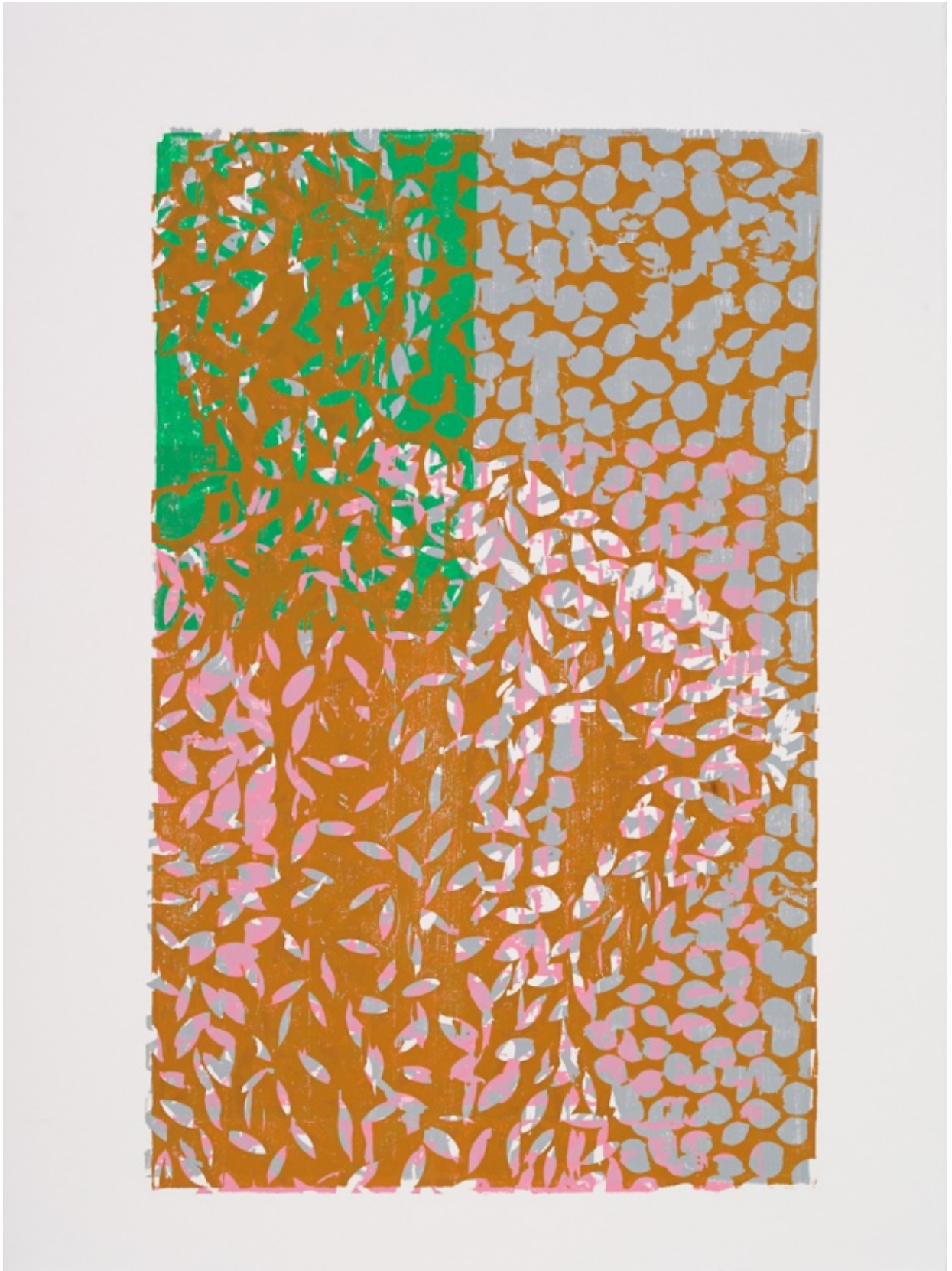
Triest oder die Götter, Fragment VI, 2019, Farbholzschnitt, 76 x 56 cm