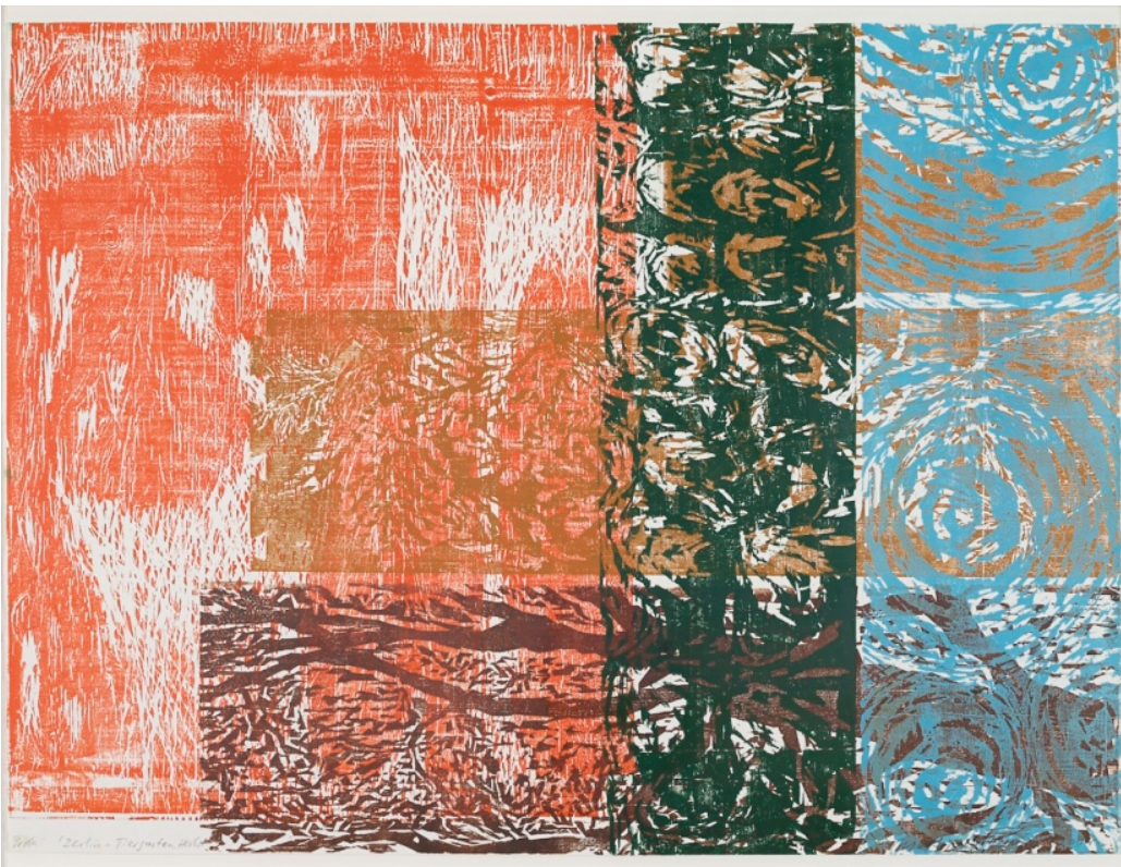
Berlin-Tiergarten, Herbst, 2006, Farbholzschnitt, 97 x 127 cm