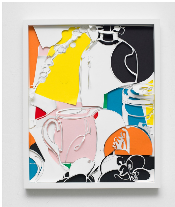
Obst und Gemüse 3, 2017, Grafitstift, Papier, 50 x 40 cm