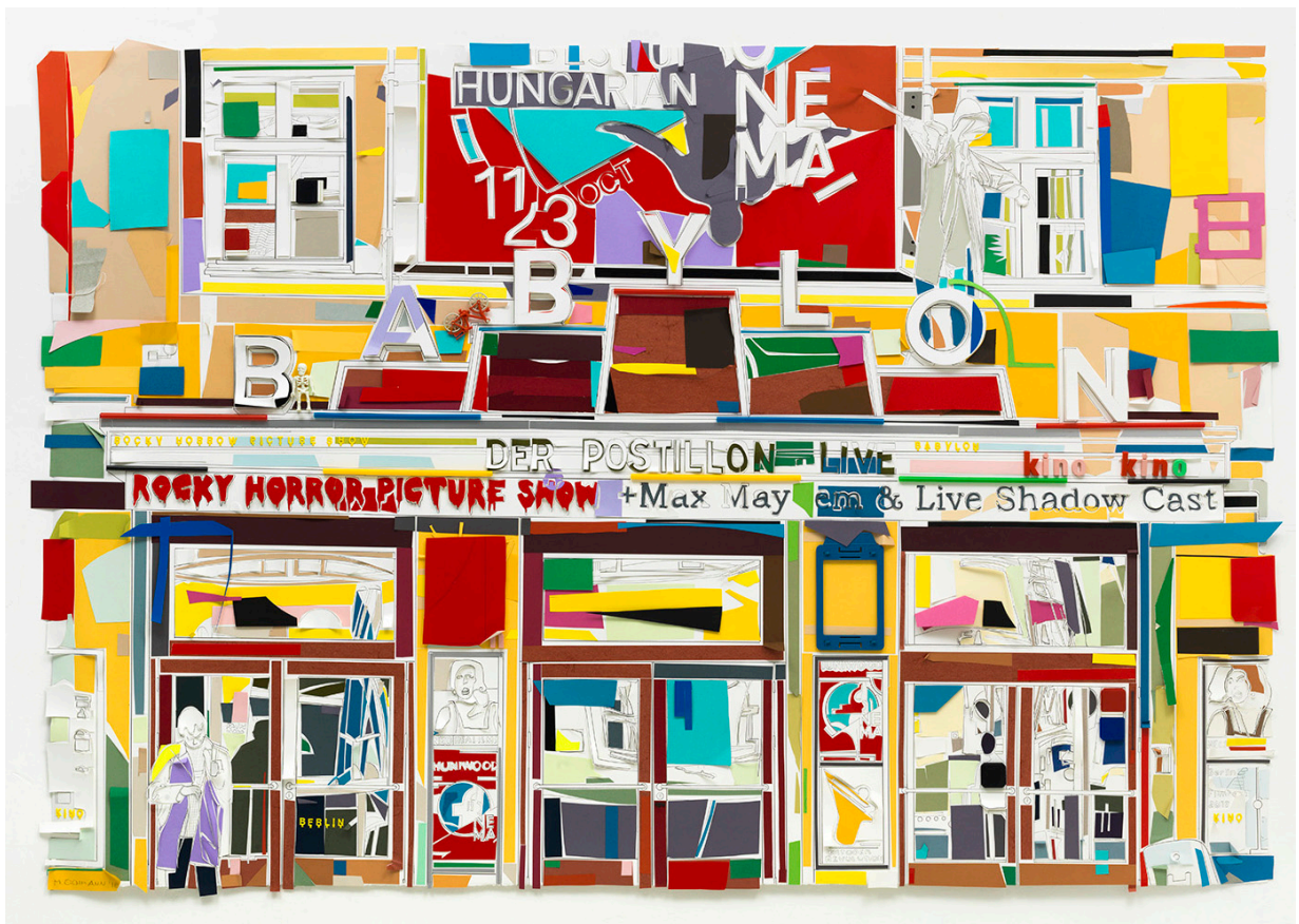
Babylon, 2018, Papier, Pigmenttusche, Fundstücke, 126 x 186 cm