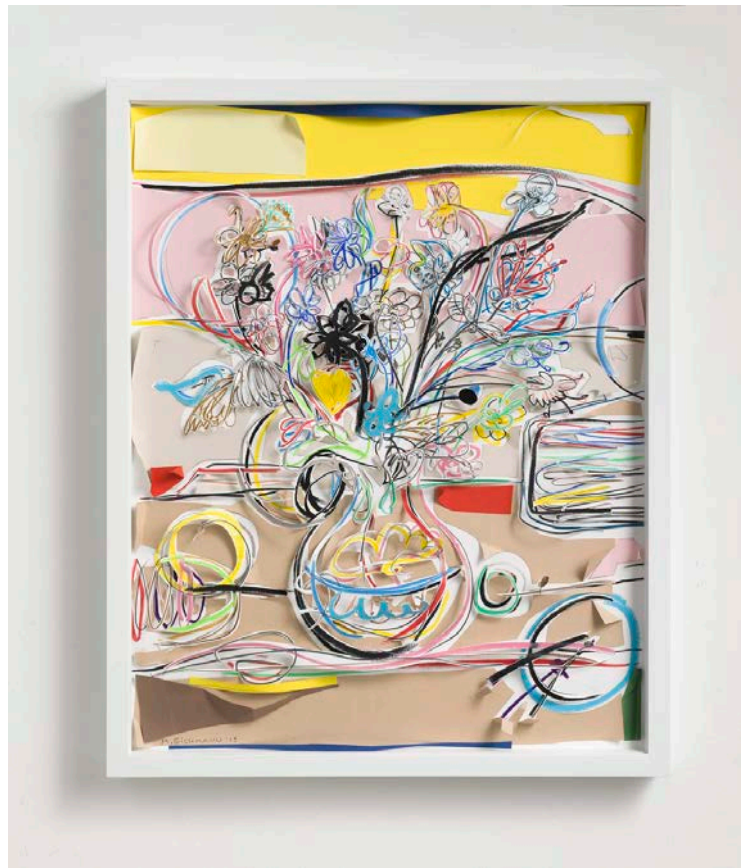
Blumen 3, 2019, Papier, Buntstift, Ölpastell, 50 x 40 cm