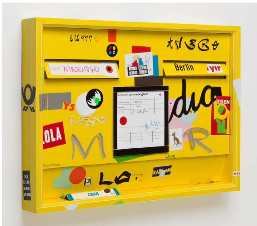
Briefkasten, 2019, Papier, Pigmenttusche, Holz, Glas, 53,5 x 73,5 x 9 cm