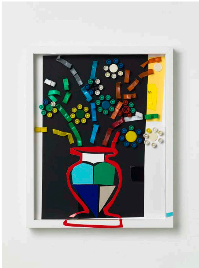
Blumendecor 1, 2017, Papier, Fundstücke, 32 x 26 cm