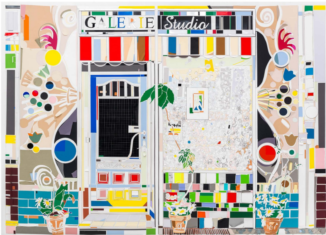
Galerie Studio, 2018, 2-teilig, Papier, Buntstift, Pigmenttusche, 210 x 285 cm