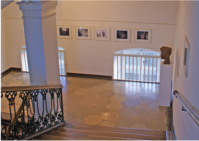
Blick in die Ausstellung - Arbeiten auf Papier