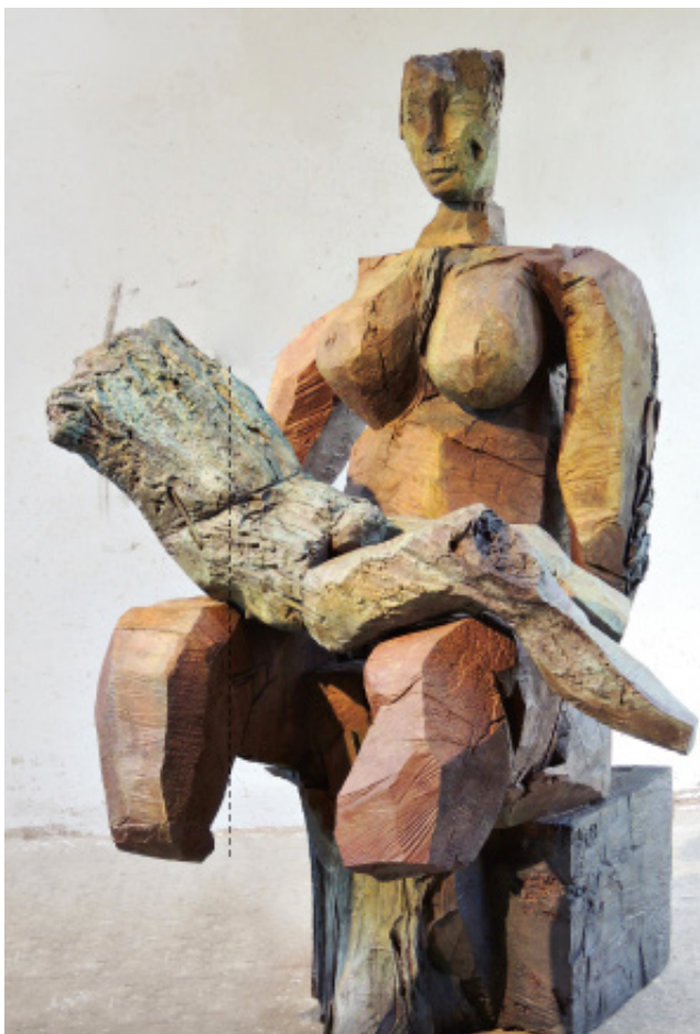
Pietà a Lepp, 2013 Bronze 189 cm 3 Exemplare