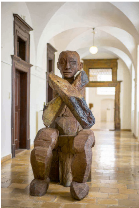
Konznow cogitar, 2013, Bronze, Höhe 210 cm, 6 Exemplare