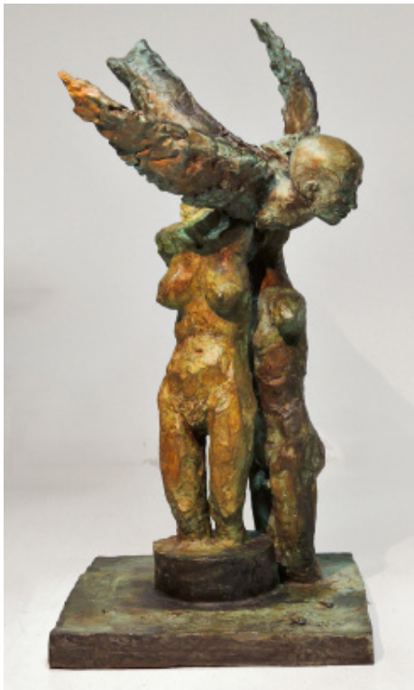
Figur 323 - 325, 2015, Bronze, 40,3 cm