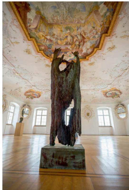
Ahrebienspring, 2015/2016, Bronze, Höhe 207 cm, 6 Exemplare