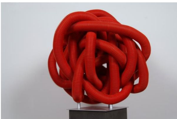
Skulptur im Gordischen Stil, Foto: Werner Scheuermann, 1998

Skulpturen im gordischen Stil stellen den Bezüge zur griechischen Mythologie sowie zu einer Legende Alexander des Großen her, die die Lösung von scheinbar unlösbaren Problemen thematisiert und die Möglichkeit einräumt, dass es dennoch auch unlösbare Probleme geben kann. Formal stellt die Arbeit gestalterische Fragen: Wie geht man als Künstler mit dem Material um. Zerstören kommt für Hörl nicht in Frage. Er hat sich grundsätzlich dafür entschieden, das Material, so wie es ist zu akzeptieren, dessen Talente und Eigenschaften zu nutzen. Die grandiose Flexibilität handelsüblicher, industrieller Kunststoffrohrrohre wird uns hier auf wirkungsvolle, wahrhaftige Weise vor Augen geführt.